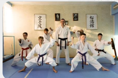
восточное боевое единоборство, дисциплина «Сетокан»